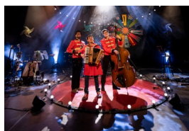
La Rampe Concert | Chanson GS → CM2