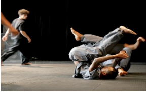
La Rampe Création | Danse | Hip-hop CE2 → CM2