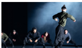
La Rampe Danse CM1 → CM2