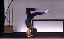
La Ponatière Création | Danse | Musique PS → GS