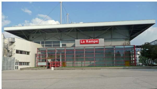
La Rampe : 15 avenue du 8 mai 1945, 38130 Échirolles

~ Le lieu de rendez-vous : La Rampe ou La Ponatière ? Les spectacles se déroulent dans l'une de ces deux salles : pensez à vérifier en amont le lieu de la représentation à laquelle vous allez assister.