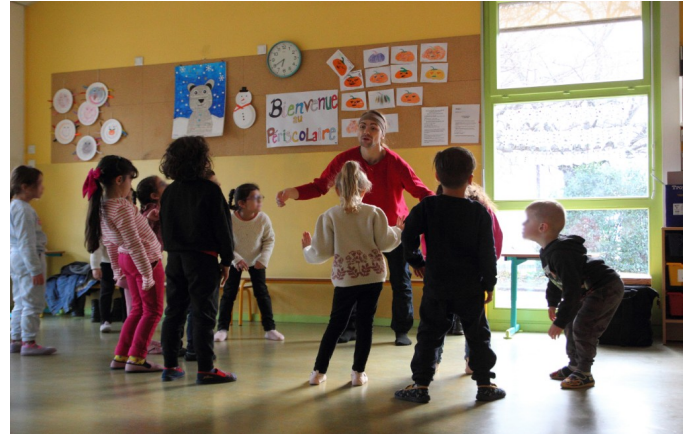
Atelier de danse avec la Compagnie Toujours Après Minuit, à l'école maternelle Françoise Dolto

Convaincue par l'importance de l'éducation par l'art, chaque saison, l'équipe travaille pour vous accompagner dans votre projet et permettre aux élèves un accès réussi au spectacle vivant. En participant à la vie artistique et culturelle, chaque jeune éveille et développe sa créativité, son esprit critique et sa sensibilité. Par ce biais, il contribue à se former et à s'émanciper en tant que personne et citoyen. Pour atteindre ces objectifs ambitieux, les actions portées par La Rampe-La Ponatière s'appuient sur les trois piliers qui fondent l'Éducation Artistique et Culturelle : la rencontre avec les œuvres, la découverte d'une pratique artistique et l'appropriation des connaissances. Elle porte également une attention toute particulière à la nécessité d'une approche globale intégrant tous les temps du jeune, rayonnant ainsi jusque dans la sphère familiale et amicale.