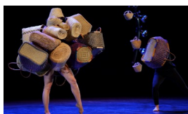
La Ponatière Création | Danse PS → CP

Après sa propre création Phoenix , la compagnie Grenade est de retour avec un programme éclectique composé de quatre pièces aux antipodes les unes des autres. Elle renoue ainsi avec l'essence même de son travail « ouvrir le corps et le mental des danseurs vers de nouvelles voies chorégraphiques ». Défi relevé haut la main par ces talentueux artistes !