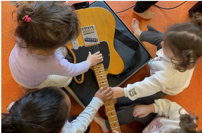
Immersion crèches avec la Compagnie épiderme, au Multi-accueil La Ponatière