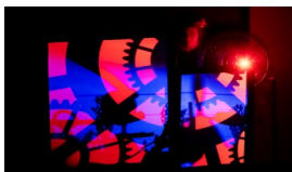
La Ponatière Création | Théâtre d'objet musical GS → CM2

Départ pour une odysée maritime faite de cerceau, trapèze, mât chinois, fil et cordages ! L'équipage composé de sept circassiens et musiciens nous guide dans une traversée infinie, naviguant entre stupéfaction et humour. Alors, bon vent !