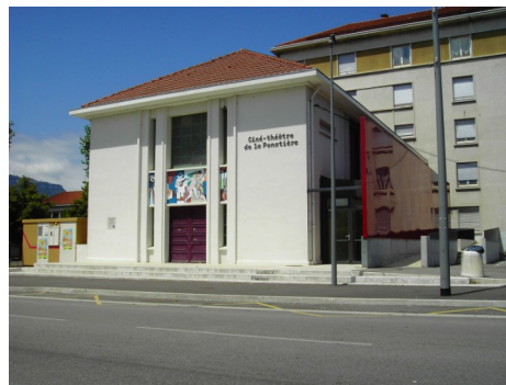
La Ponatière : 2 Avenue Paul Vaillant-Couturier, 38130 Échirolles

~ L'arrivée : Prévoir l'arrivée de votre groupe une demi-heure avant le lever de rideau. Le référent du groupe est invité à récupérer les places auprès de la billetterie et à distribuer un billet à chaque élève avant l'entrée en salle. Une personne de l'équipe d'accueil vous orientera et vous rappellera les éléments à ne pas oublier avant de rentrer dans la salle.